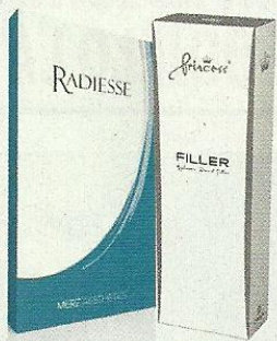
Preparat Radiesse z hydroksypapatem wapnia zastosowano do korekty linii żuchwy, Princess Filler z kwasem hialuronowym zaś do wypełniania doliny łez.