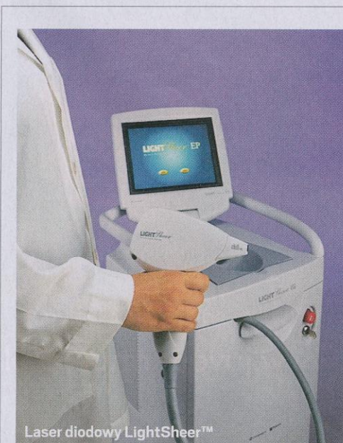
Laser diodowy LightSheer™

Tak, poprawia nastrój, zwiększa wiarę w siebie. Te zabiegi i ich efekty są źródłem zadowolenia zarówno dla pacjenta, jak i dla lekarza, który je wykonuje. ■